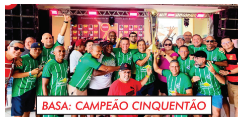
BASA: CAMPEÃO CINQUENTÃO