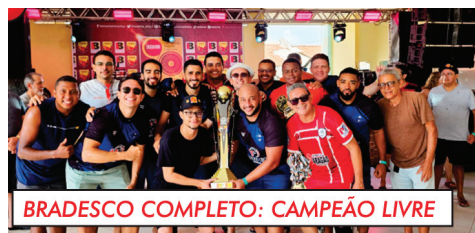
BRDESCO COMPLETO: CAMPEÃO LIVRE