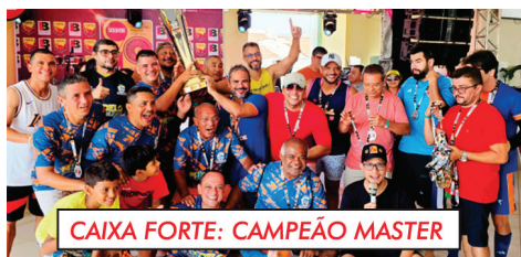
CAIXA FORTE: CAMPEÃO MASTER